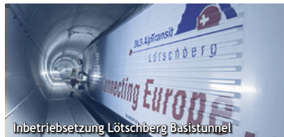
Inbetriebsetzung Lötschberg Basistunnel