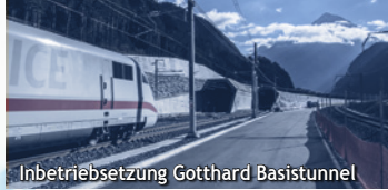
Inbetriebsetzung Gotthard Basistunnel