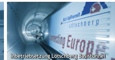
Inbetriebsetzung Löttschberg Basistunnel