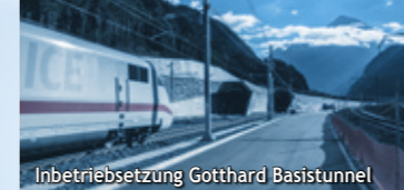
Inbetriebsetzung Gotthard Basistunnel