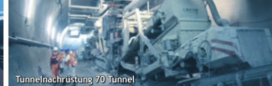
Tunnelnachrüstung 70 Tunnel